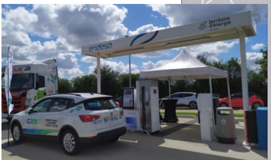
Station BioGNV ARON