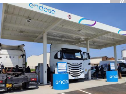
Station BioGNV CHANGÉ